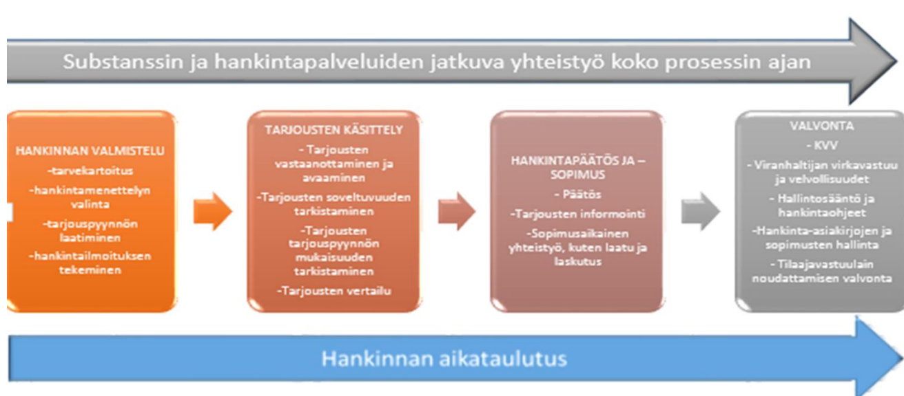
Kuvio 1. Hankintaprosessi

Hankintaprosessin peruskaava on jotakuinkin samankaltainen, oli hankintatapa millainen tahansa. Oleellista hankintaprosessissa on hankintaan tarvittava aika, perusteellisen hankintasuunnitelman laatiminen ja riittävä resursointi siitähän huolimatta että käytössä on sähköisiä hankintajärjestelmiä (ClouDia ja Hilma). Oheisessa kaaviossa on kuvattu perushankintaprosessi, jossa voidaan määritellä neljä pääkohtaa, hankinnan valmistelu, tarjousten käsittely, hankintapäätös ja – sopimus sekä valvonta. Oleellista on, että hankinnan valmistelu aloitetaan hankintasuunnittelulla, jossa ajastetaan koko prosessi ja varataan hankinnan toteutukseen riittävät resurssit, sovitaan vastuut ja varmistetaan hankintavaltuudet, käytettävä menetelmä sekä kokonaiskustannukset.